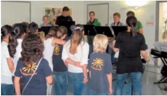
Die Schülerband der Robert-Koch-Realschule spielt vor WrapRap von Klasse 9.