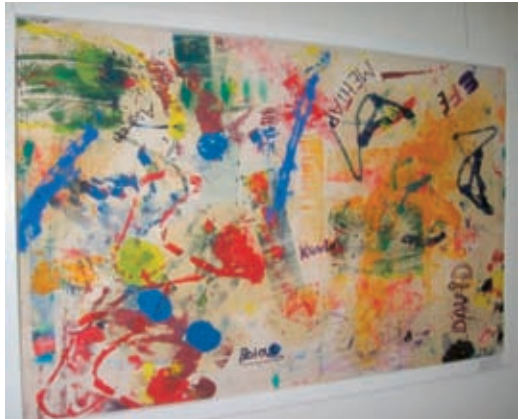
WrapRap ganz groß.