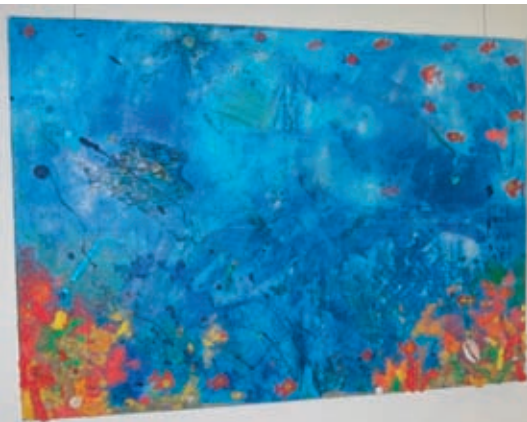
Der Korallengarten der Klasse 7b in der Schulkunstaussstellung.