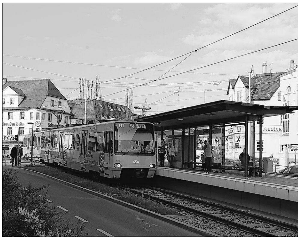
Mittlerweile haben sich das Gesicht der Stadtbahn, der Haltestelle und des Schillerplatzes verändert.