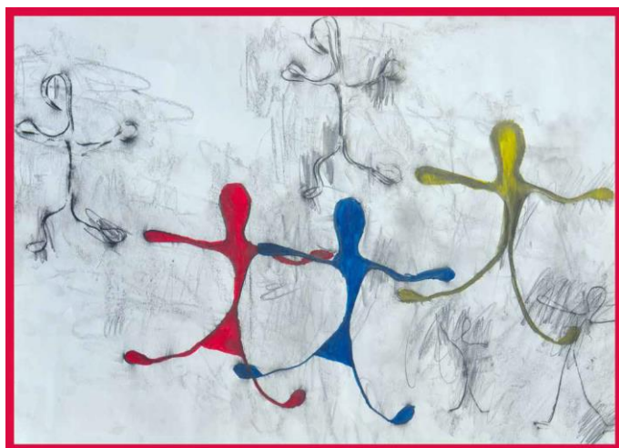
Ein Bild aus dem gemeinsamen Kalender der Stuttgarter SBBZ gE und kmE